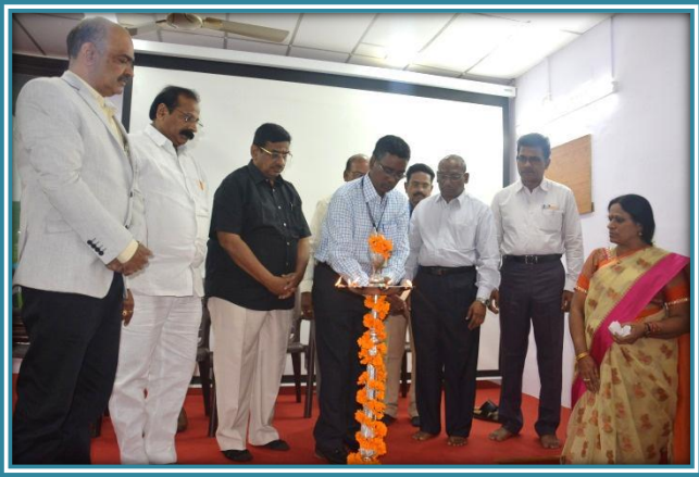
Lighting of the Lamp by delegates